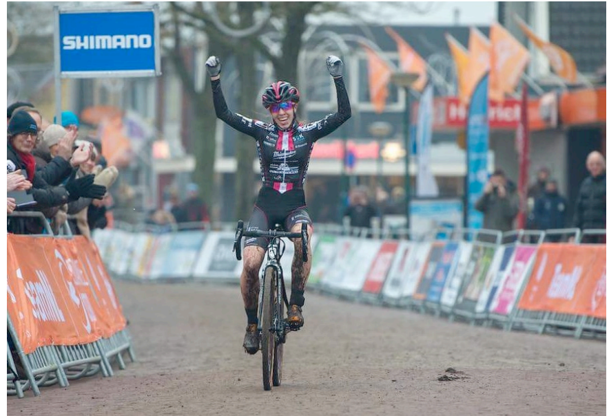
Shirin van Anrooij Nederlands kampioen veldrijden 2018