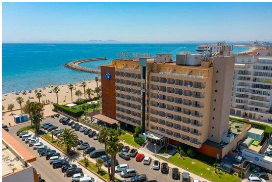
Prestige Victoria Elit

Avinguda de la Gola de l'Estany 17480 Roses, Girona, Spanje