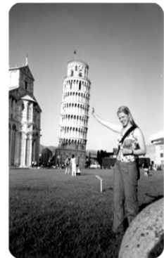
Toren van Pisa: fotomoment!

Pisa werd in de 5 e eeuw v.C. gesticht door de Grieken, later kwamen de Etrusken en de Romeinen. Wij kennen Pisa vooral van de Scheve Toren, maar die is maar een onderdeel van het 'Veld der Wonderen': de toren, de dom, het baptisterium en de begraafplaats vormen volgens kenners de mooiste compositie van romaanse en gotische bouwkunst in Italië. Alle gebouwen op dit plein staan een beetje scheef door de slechte fundering en de moerasachtige ondergrond. Met de bouw van de Scheve Toren is begonnen in 1173 en al bij de derde verdieping begon de toren te hellen. Toch bouwde men gewoon door, tot de toren in 1350 af was.