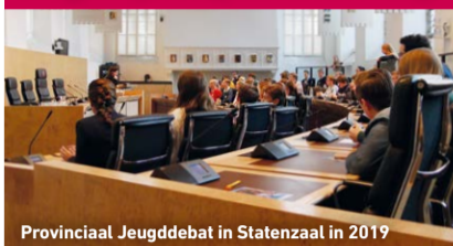
Provinciaal Jeugddebate in Statenzaal in 2019

Jongeren betrekken bij provinciaal beleid is een van de taken van de Provincie Zeeland. Hoewel we dat het liefst doen tijdens bijeenkomsten waarin we elkaar ontmoeten in het provinciehuis, gebeurt dit nu hoofdzakelijk digitaal. Zo debatteerden de jongeren vol overgave tijdens het Provinciaal Jeugddebate op 24 november 2020: de opmaat naar het Nationaal Jeugddebate in Den Haag. Op 12 december 2020 vindt World Schools Academy plaats. Meer lezen en aanmelden? Kijk dan op www.jouwzeeland.nl .